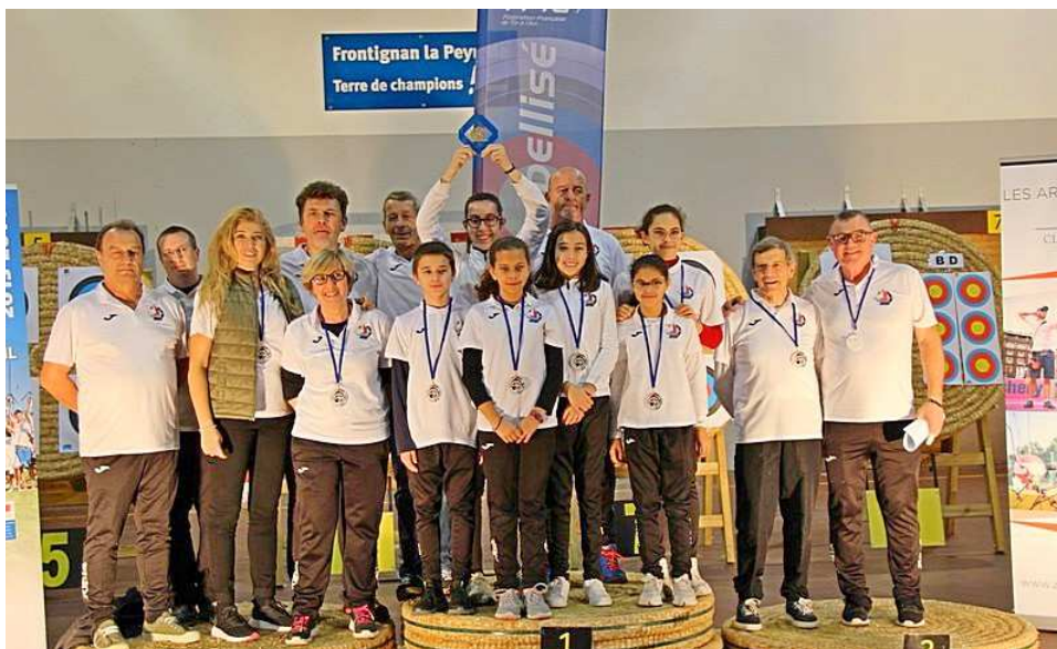
Très bon début de saison pour les Archers du Soleil.

Le club a déjà organisé 2 compétitions salle Soubrier de Frontignan, avec une participation massive. La dernière en date a eu lieu les 30 novembre et 1 décembre.